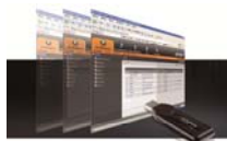
標準価格: ライセンスにより異なります。詳しくはお問い合わせください。