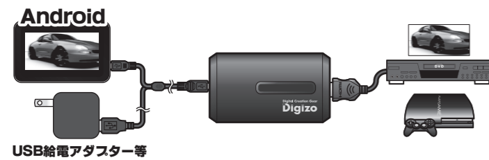
USB給電アダプター等