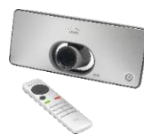
TelePresence SX10 Quick Set